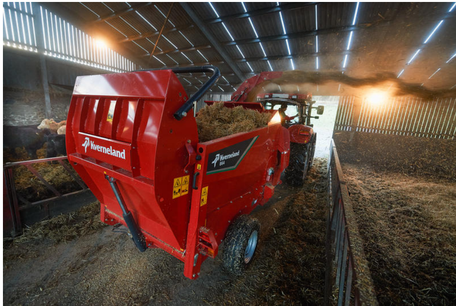
Kverneland 864 Pro con tubo girevole

L'introduzione di questo nuovo modello trainato aumenta decisamente gli standard qualitativi nella distribuzione della paglia nelle lettiere.